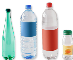
Les bouteilles d'eau, de soda, de jus de fruits