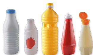
Les bouteilles de lait, d'huile, flacons de ketchup, de mayonnaise