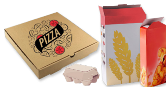
Les emballages en carton (cartons pizza, paquets gâteaux, boîtes de céréales, d'œufs)