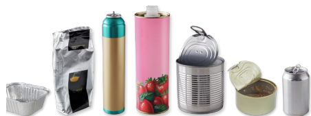
Les barquettes, les sachets de café, les aérosols, les bidons, les boîtes de conserve et les canettes de boisson