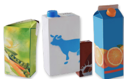
Les briques alimentaires