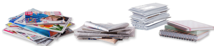
Les journaux, magazines, publicités, prospectus, courriers, enveloppes, cahiers...