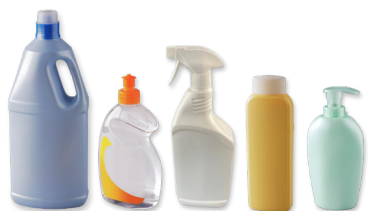
Les flacons de produits ménagers, les flacons de shampooing et de gel douche