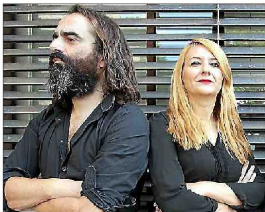
▶ The Limiñanas, un nom qui fait frémir tous les fous de rock des Pyrénées-Orientales, de France et d'Europe. Outre la sortie de son nouvel album, le groupe de Cabestany a également signé, cette année, une reconnaissance médiatique hexagonale et mondiale.