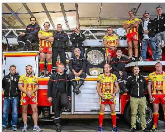
▶ La grande famille du XV s'est encore distinguée en 2018. La preuve avec l'association Rugby Pompiers Catalans qui, pour la seconde année consécutive a décroché le titre de champion de France.