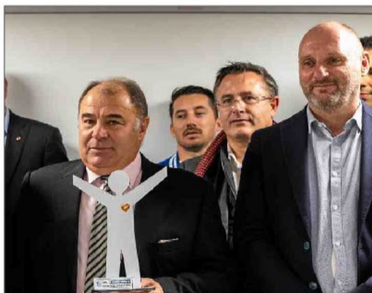
▶ Ils l'ont pris aux Anglais pour le plus grand plaisir du peuple catalan ! En août, les Dragons Catalans ont remporté la fameuse Cup. Pourtant, rien n'était gagné en début de saison. Mais à force de courage et de persévérance ces Catalans ont réalisé l'impossible.